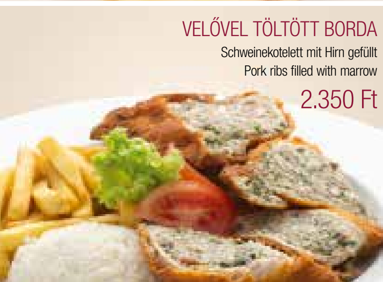
VELÓVEL TÖLTÖTT BORDA

Schweinekotelett mit Hirn gefüllt Pork ribs filled with marrow