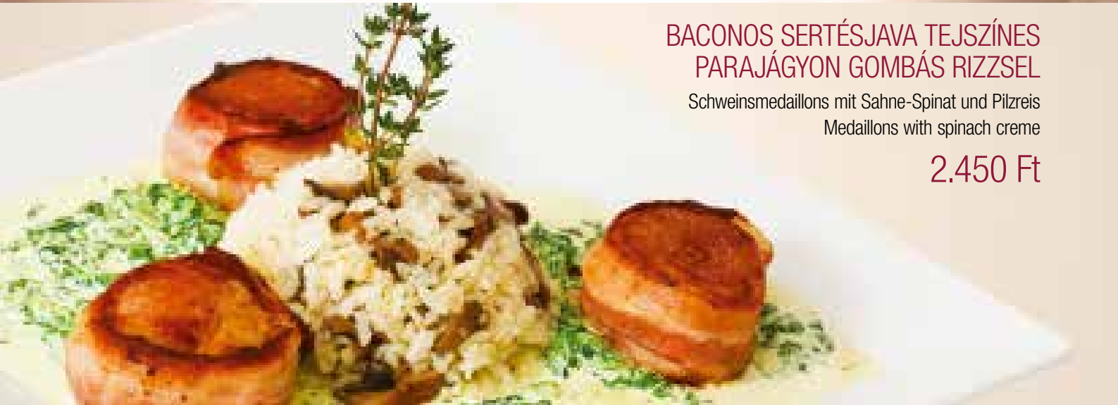
BACONOS SERTÉSJAVA TEJSZÍNES PARAJÁGYON GOMBÁS RIZZSEL

GERICHTE AUS SCHWEINEFLEISCH • PORK DISHES